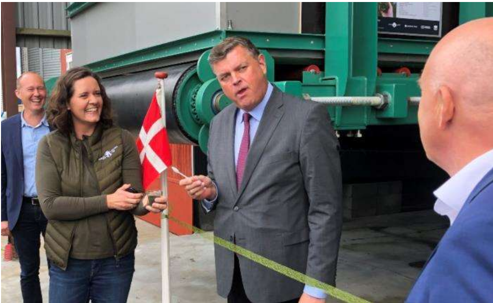
Ausumgaard / Vestjyllands Andel