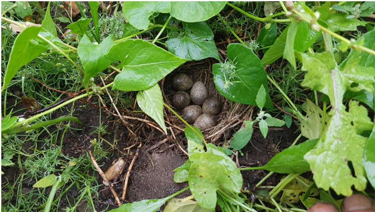
Frøblandinger, som på billedet her, der har andre formål end kløvergræsblandinger administreres efter samme regelsæt.

Herunder er en nærmere beskrivelse af reglerne for firmablandinger, gårdblandinger og frø som landmanden selv blander.