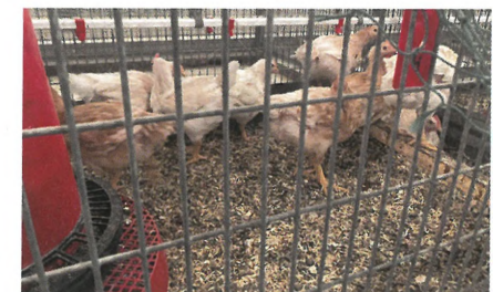
Fig 5. Forsøgskyllinger i mindre bokse i forsøgsstalden i Foulum.

forsøgsstalden d. 24. november, og så at kyllingerne trives fint (figur 5). En del af kyllingerne blev slagtet ved Rokkedahl og sendt til forskellige spisekvalitetsundersøgelser hos Københavns Universitet i regi af Arbejdsplanke 3. Alle forsøgsresultaterne er nu under bearbejdning og offentliggøres senere i 2024. I regi af Arbejdsplanke 5 bliver der i anden halvdel af 2024 udført et praktiske kyllingeboksforsøg med økologisk algeprotein mv. samt demonstration af forsøgsresultater hos Rokkedahl.