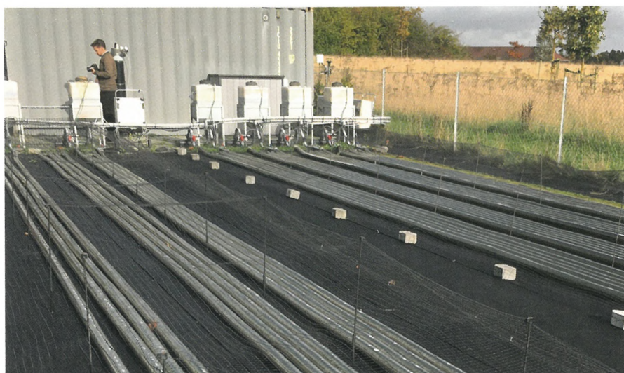
Figur 1. Mikroalge dyrkning i plastikrør placeret hos TI i Høje Tåstrup.

En anden motivationsfaktor for at produ-