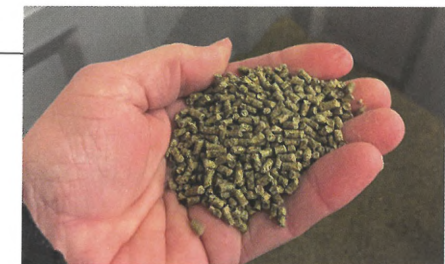
Fig 4. Foder med alge- og ærtprotein.

Ud fra de foderblandinger der ses i tabel 2, fremstillede Aarhus Universitet i Arbejdsplanke 2 fire forsøgsfoderblandinger med varierende indhold af alge/ært blandingen. Se eksempel på det færdige foder i figur 4. Forsøgsfoderblandingerne blev testet i fordøjeligheds- og fodringsforsøg ved Aarhus Universitet i Viborg. Hele projektgruppen besøgte