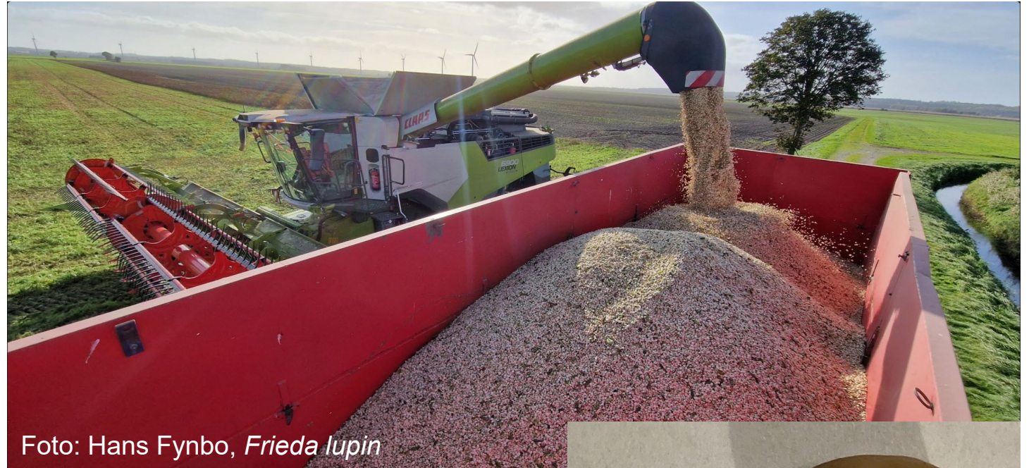
Frieda lupin