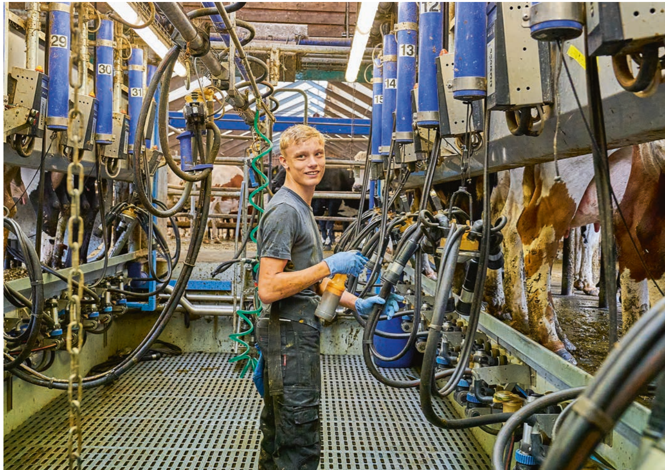
Fremstillingsprisen på mælk er præget af de stigende omkostninger til især foder og energi.