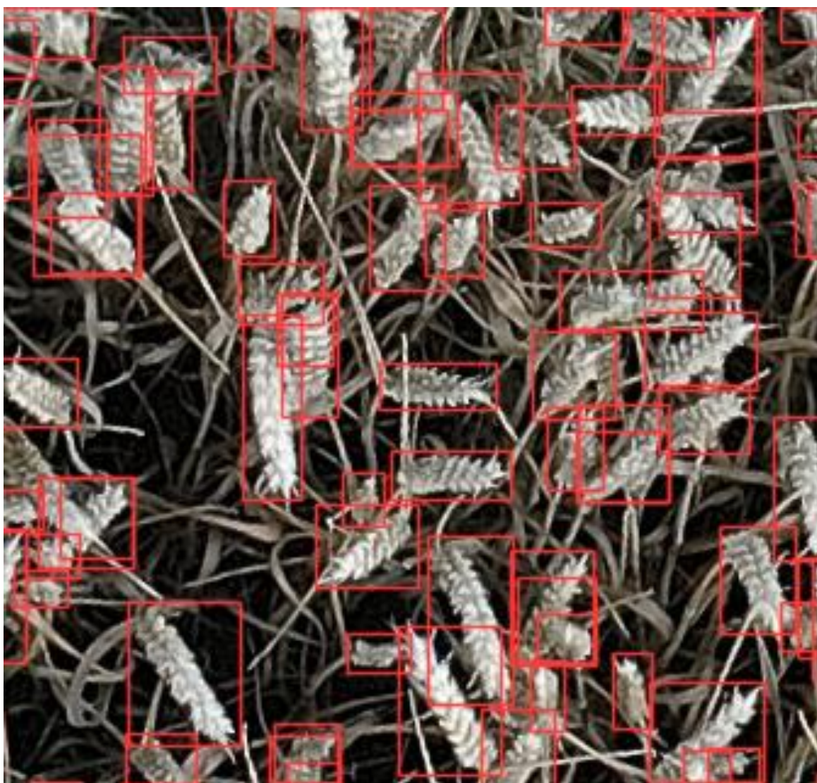
Figur 2: Eksempel på output fra en YOLOv8 model, som er trænet af Teknologisk Institut til at genkende og tælle hvedeaks i dronebilleder taget med højopløsningskamera.

holde sig for øje, at CV-modeller ikke kun behøver virke i det visuelle spektrum, men også kan køre på andre sensorinputs som f.eks. NIR, NIT og hyperspektrale sensorer.