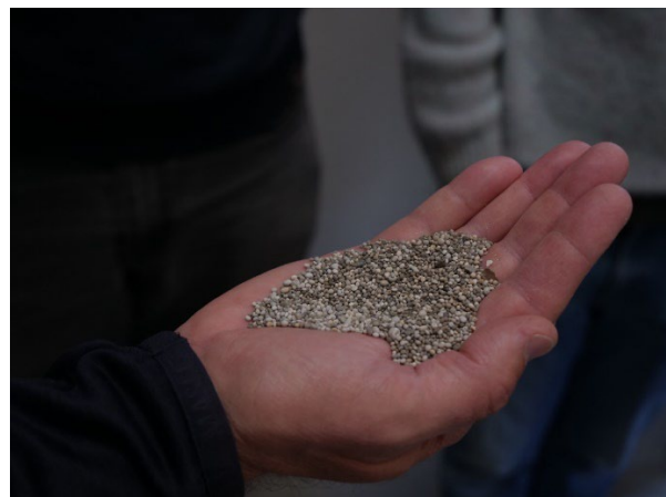
Billede 2: Struvit fældet fra rejeftvand fra udrådnet spildevandsslam, klar til at bruge som gødning i marken.