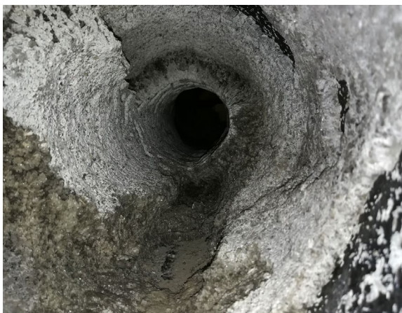
Billede 1: Uønsket udfældning af struvit i spildevandsrør.

Struvit der anvendes til gødning (Billede 2) udfældes ved en kontrolleret proces på rensningsanlæg, der har etableret anlæg hertil. Udover at hindre tilstopning af rør og pumper mv. er der flere fordele for anlæggene ved at producere struvit. Udfældning af struvit bevirker at mængden af rejeftvand, der skal recirkuleres i rensningsprocessen, reduceres markant, og det optimerer kapaciteten på anlæggene, idet ca. 30 % af fosforen i spildevand udfældes som struvit. Dette bevirker, at der kræves mindre kapacitet til kemisk eller biologisk fældning af fosfor senere i rensningsprocessen. Den størst mulige genindvinding og recirkulering af fosfor fra spildevand er ønskelig, da fosfor til gødning, globalt set, er en begrænset ressource og en forudsætning for at opretholde verdens fødevarerproduktion.