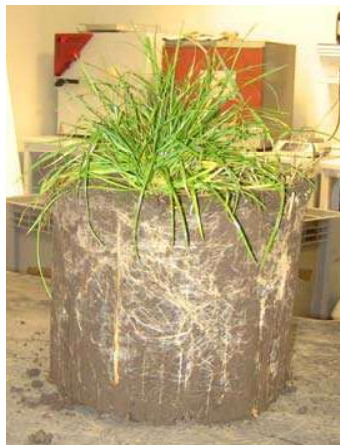
Figur 1: Udtagning af intakt jord-kerne med rajgræs i November 2020 (PVC cylinder til 20 cm dybde ses på figur 3).