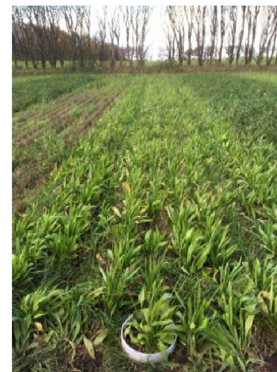
Figur 3: Lancetbladet vejbred som efterafgrøde i November 2020.

I samarbejde med AgrolIntelli udvikler vi et kamera-værktøj baseret på kunstig intelligens til bestemmelse af efterafgrødebiomassen, således at gødningseffekten af efterafgrøderne kan bestemmes og indgå i gødningsplanlægningen for den efterfølgende hovedafgrøde.