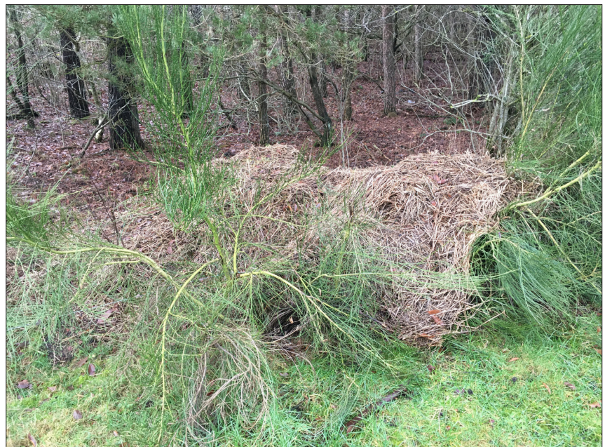
Figur 1. Billeder taget af landmænd blev brugt til diskussion af hvordan biodiversitet kan forstås mellem landmænd og forskere i Organic+. Det visuelle blev derfor en bro mellem faggrupperne. Billede 1: Viser indsatsen i at skabe et nyt levested – udsætning af en halmballe, som insekthotel – Billede 2: Viser resultatet af tiltaget – der er kommet arter til, der har fået gavn af halmballen]