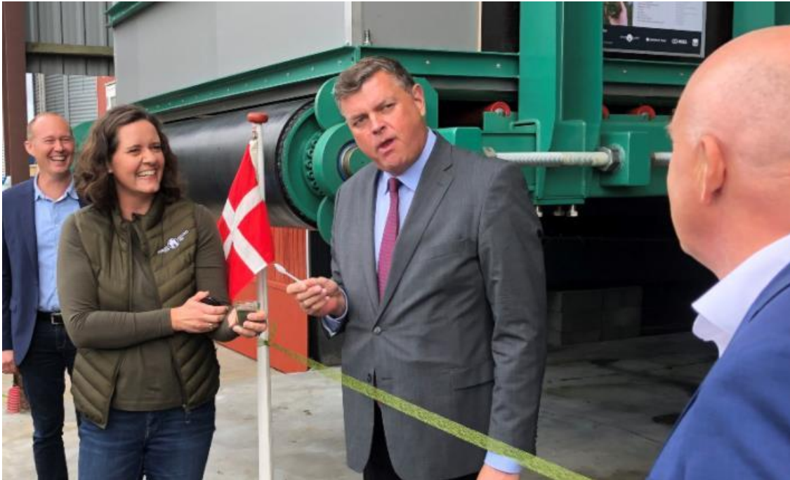
Ausumgaard / Vestjyllands Andel