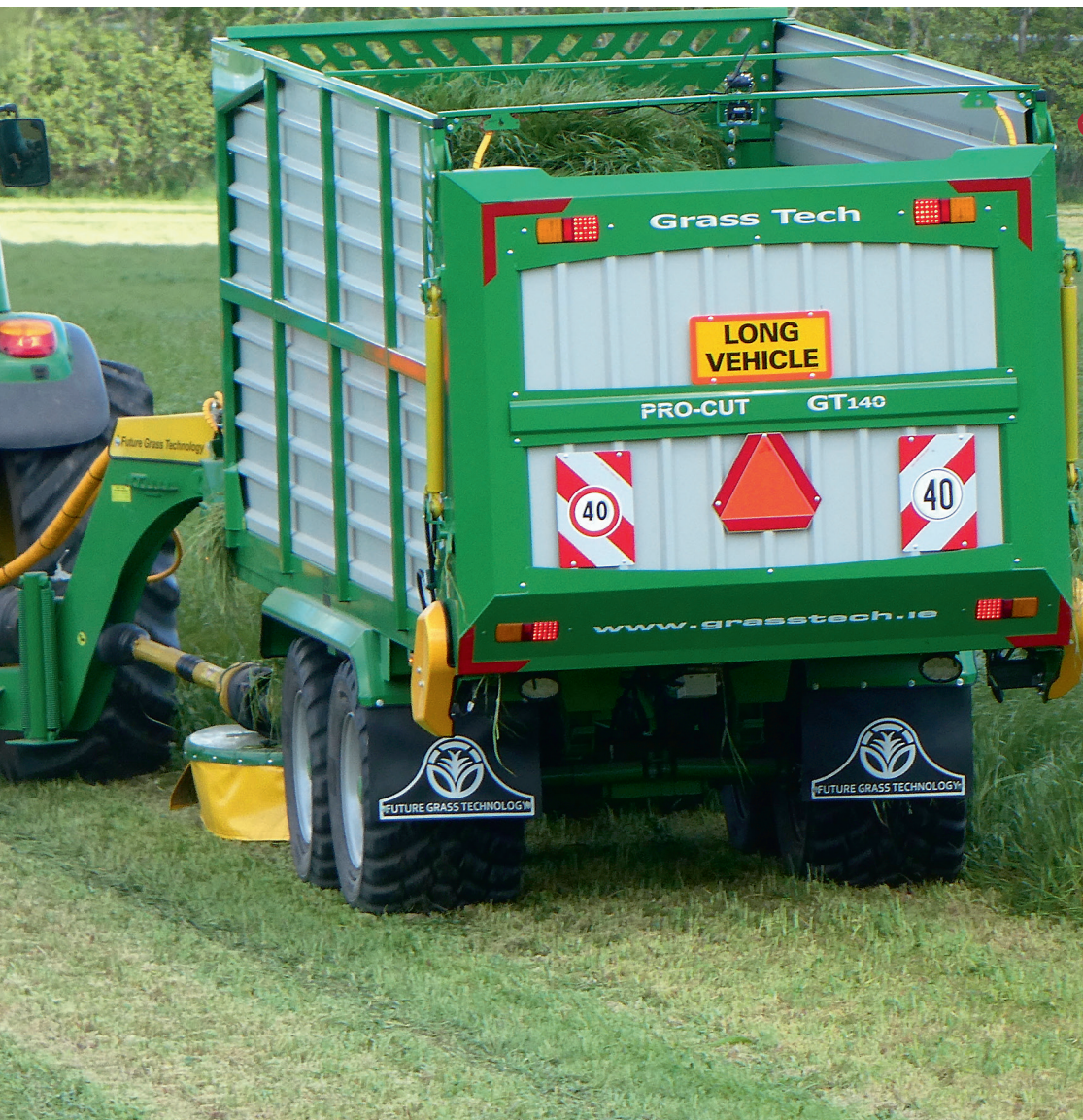
← Helgræshøst med MaksiGrass.