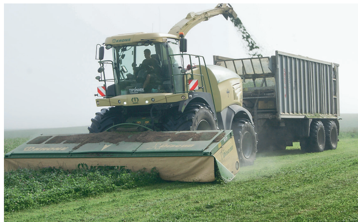
Finsnitter med 6,3 meter helsædsbord og frakørselsvogn i SIWI-træk.