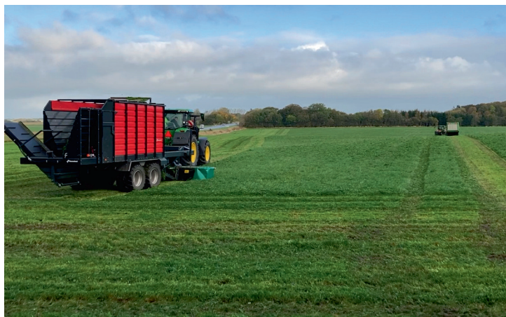
Kvernelands prototype-helgræshøster og Maksigrass ved andet testslæt 2022.

2022 høstomkostningerne i tabel 4 indikerer, at finsnitteren er cirka 4,5 øre billigere