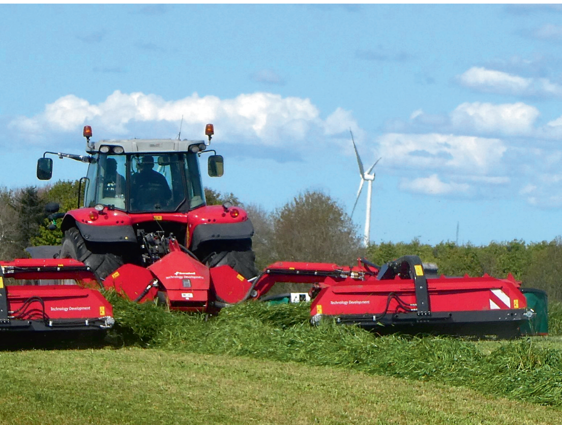
Kløvergræsset skårlægges og lægges i skår med bånd.

Forklaringen vurderes at være, at finsnittet græs er kompakt, så ilt har svært ved at trænge ind i stakken. Helgræs pakker ikke. Derfor har ilt let adgang, og nedbrydningsprocessen accelereres.