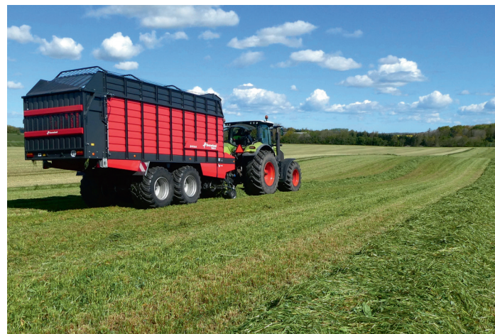
Kløvergræsset opsamles med snittevogn fra skår.