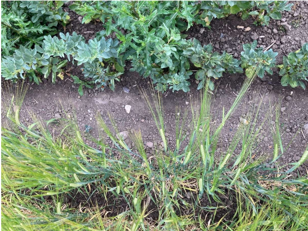
Naboafgrøder af vårbyg og hestebønne.