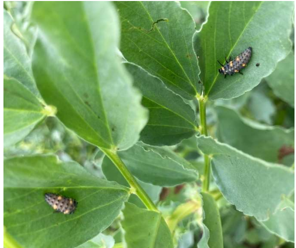
a) Marienhøne b) Marienhønelarve.