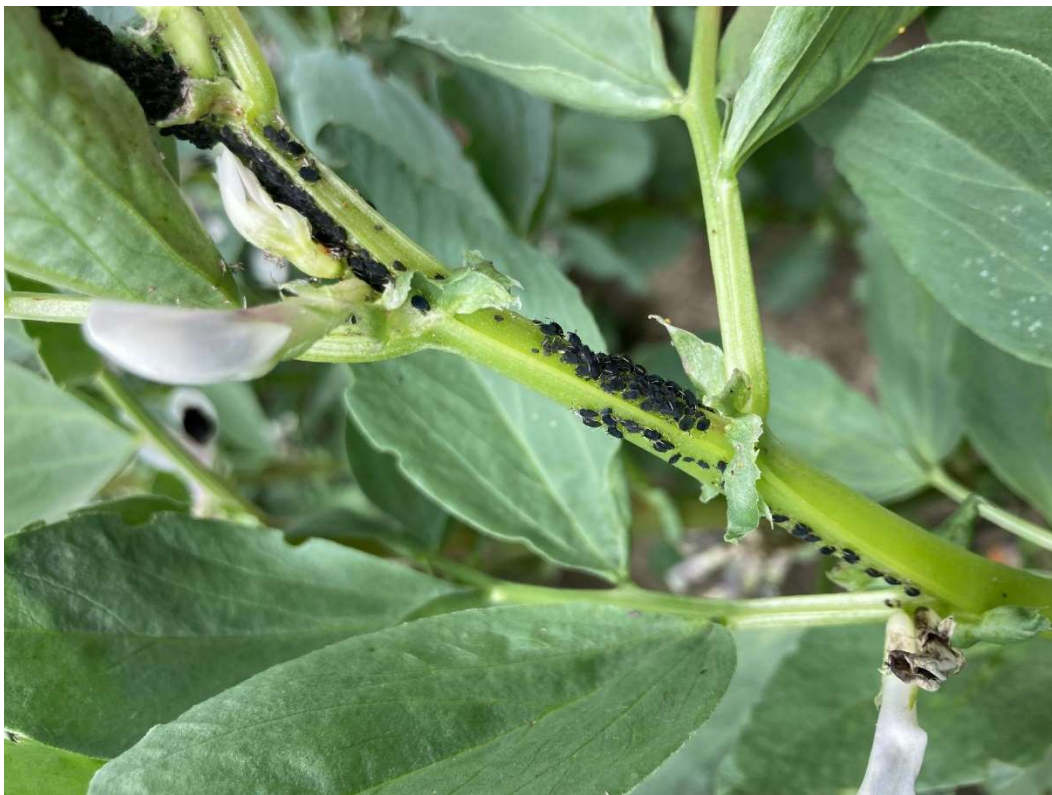
Bedebladlus på hestebønne.