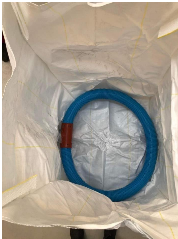
Billede 2. Drønrør anbefales med en diameter på \geq 200 mm.

I bunden af tørreposen placeres drønrør med en diameter på \geq 200 mm. Det skal understreges, at metoden kræver overvågning af tørringsprocessens ensartethed. Det er altid en god idé at lave en kort omrørersnegl monteret på en boremaskine, som med mellemrum kan anvendes til omrøring af tørreposen.