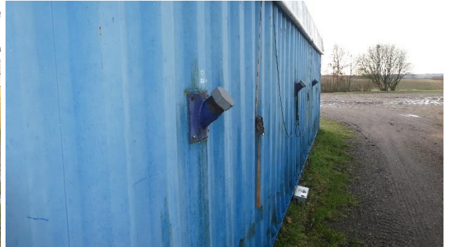
Billede 9. Containere opstillet udendørs med presenningstag. Billede 10. Studsen i containerens side til prøvetagning.

Presenningstaget er lavet så presenningssenden på billedet kan være åben under tørring, så den fugtige lugt blæses ud. AgroEx har lavet anlægget. De har erfaring for, at containerne oftest står uden presenning under tørringen. Vurderinger er, at det skal regne en del, før det er nødvendigt at lukke presenningstaget. Der er monteret tre studse i hver container, så der med et prøvespyd kan udtages prøver under tørringen.