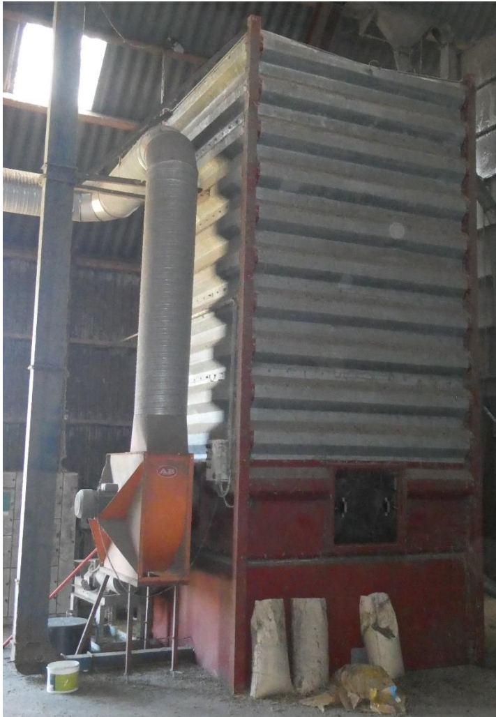
Billede 13. Portionstørreriets kontinuerlige cirkulation under tørringsprocessen sikrer ensartet tørring. Tørreluft blæses udendørs.

Der dyrkes 14 afgrøder, hvoraf 11 er konsumafgrøder. Der er opbygget en lade målrettet tørring, rensning og opbevaring af små afgrødeportioner. Alle afgrøder forrenses i et Westrup soldrenseri med stigluftrrensning. Tørring foretages i tre ældre AB portionstørrerier med kontinuerligt gennemløb, der har to blæsere. Én til indblæsning og én til udsugning af tørreluft, der blæses ud af laden.