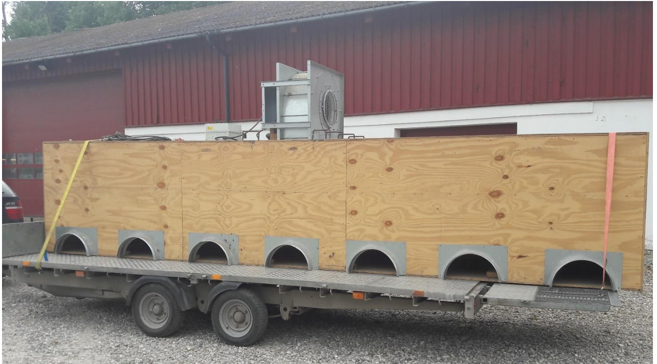
Billede 6. Mobil hovedkanal der kan laves i alle størrelser og placeres isoleret, så glutenforurening undgås.

Idéen er også oplagt til tørring af partier der skal holdes glutenfri. En mobil hovedkanal kan laves i alle størrelser, og er fleksibel i forhold til hvor mange rækker rundbuekanaler der udlægges, og hvilke længder. Husk at der bør være minimum en halv meter afgrøde over rundbuerne.