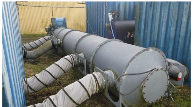
Billede 11. Rundbuer placeres mellem styreskinner i bunden. Billede 12. Interimsistisk hovedkanal mellem containerne.

I containerens bund er der fastgjort styreskinner, så rundbuekanalerne ikke forskydes under ifyldning. Hullerne til luftadgang kan se bagerst i containeren. Mellem containerne er der lavet en interimsistisk hovedkanalens med et lukkespjæld pr. luftafgang.