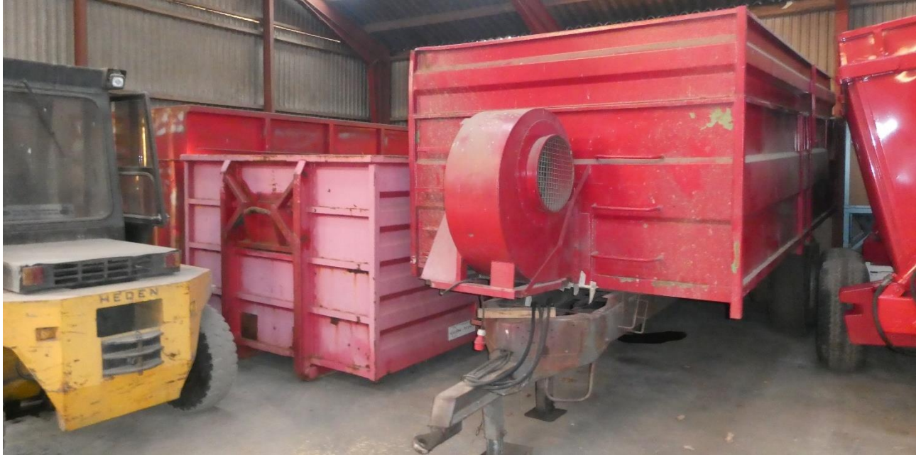
Billede 7. Brugt vogn hvor der er indbygget en perforeret bund og en blæser.

Tørrevogne, som herunder, er en mobil løsning, der er arbejdsvenlig og som let kan placeres isoleret. I de mest simple udgaver købes der en gammel vogn, hvor der indbygges en perforeret bund og en blæser.