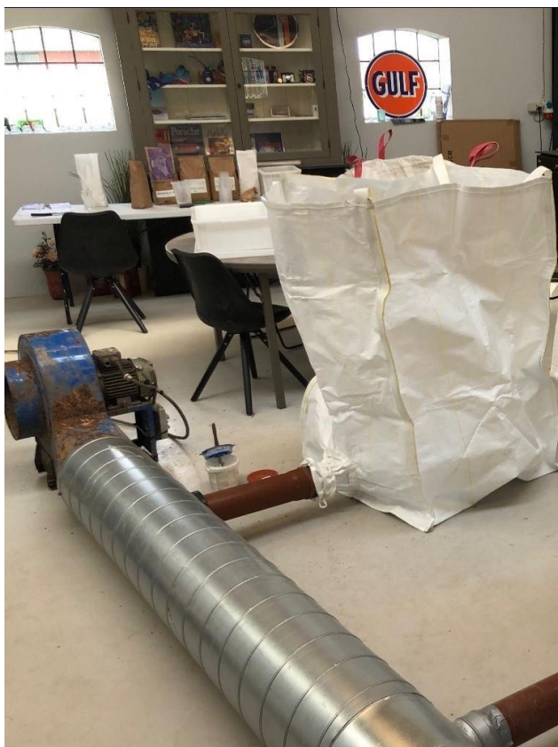
Billede 1. Opsætning med improviseret hovedkanel.

Opsætningen består af tørreposer, der kan placeres i et område, hvor der ikke håndteres andre afgrøder, for at sikre at afgrøden ikke forurenes med gluten. Tørreposerne kan leveres direkte til den virksomhed, der skal foretage oprensning og pakning. I dette tilfælde GI. Buurholdt, hvor tørreposerne også er købt.