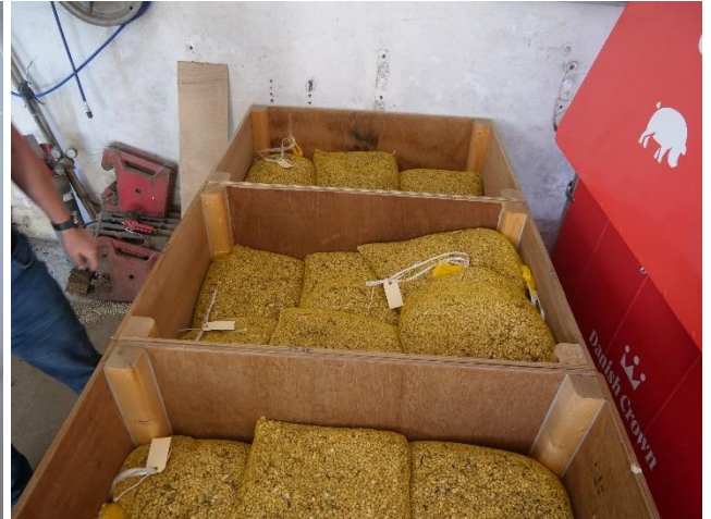
Billede 4. Tørresække pakket i tørrekasse m. perforeret bund.

Med den lille lagerhøjde i tørrekasserne, er risikoen for kondensering i toppen ikke til stede, såfremt der vælges den rette blæser, der sikrer en lufthastighed på 0,1 m/s gennem afgrøden.