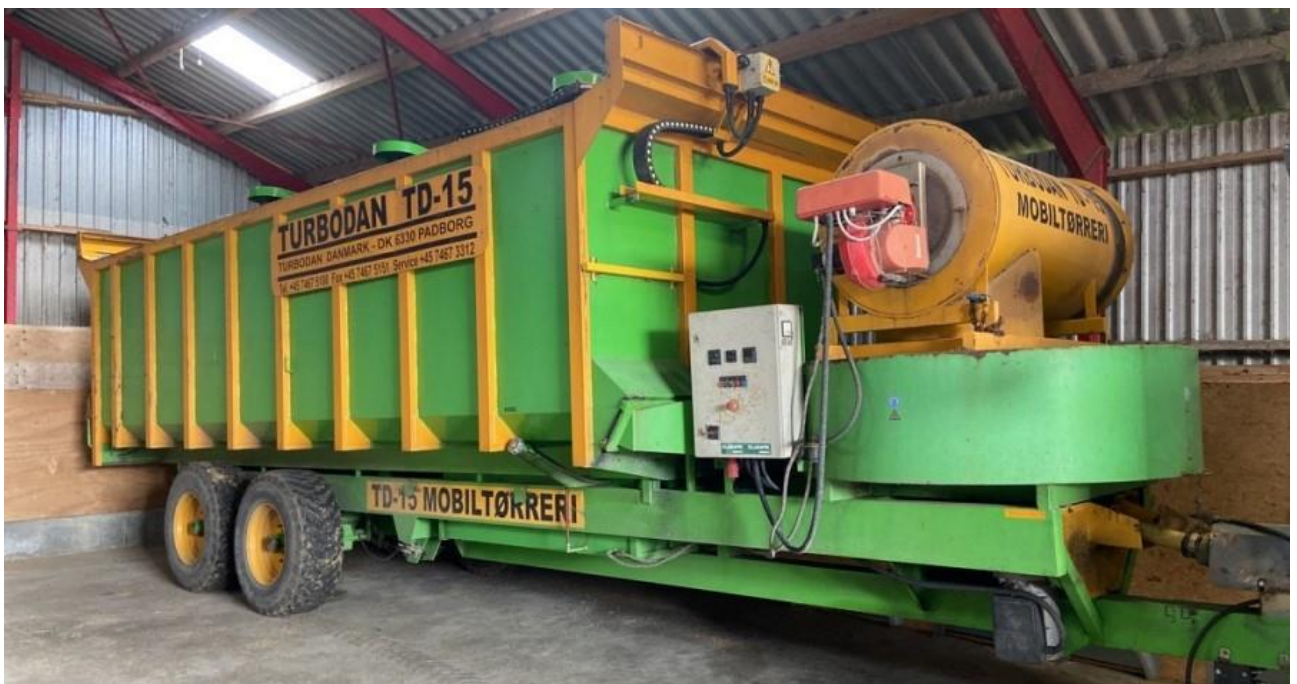
Billede 8. Tørrevogn med omrøring.

Tørrevogne med omrøring er en rigtig god løsning til tørring af våde afgrøder. Omrøringsystemet forhindrer, at der i meget urene afgrøder kan dannes områder, hvor luftgennemgangen er for lille. Tørrevogne med omrøring kan være udstyret med en meget stor varmekilde. Ved tørring af storfrøede konsumafgrøder, som hestebønner og ærter bør det sikres at varmetilsætningen ikke overstiger 5° C.