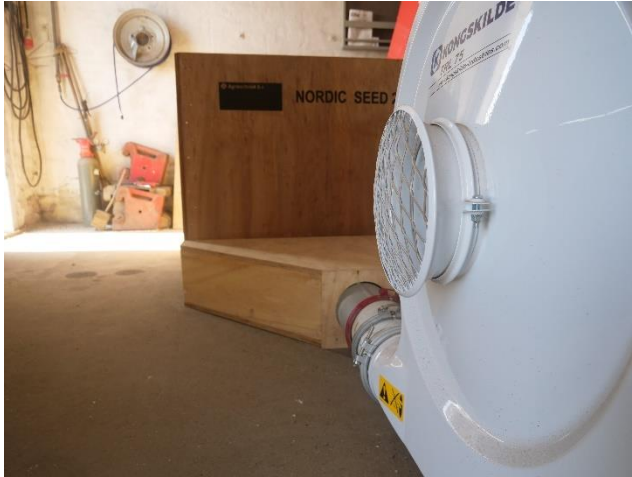
Billede 3. Små tørrekasser sat i en række med fælles blæser.

Tørrekasser har været anvendt i sortsforædlingen i mange år, netop fordi tørrekasser kan håndtere meget små afgrødemængder. Tørrekasser fås i forskellige størrelser. Øverst relativt små tørrekasser med perforeret bund, hvor afgrøden først ifyldes små tørresække. Metoden er sikker men arbejdskrævende, da afgrøden både skal sækkes op før tørring, samt ompakkes i fx storsække før levering til oprensning og pakning.