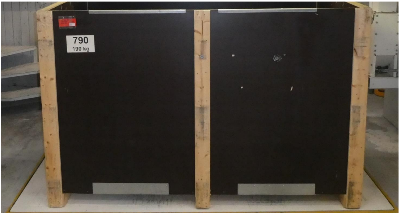
Billede 5. Stor tørrekasse med perforeret bund som fx Jensen Seed anvender.

Med den lille lagerhøjde i tørrekasserne, er risikoen for kondensering i toppen ikke til stede, såfremt der vælges den rette blæser, der sikrer en lufthastighed på 0,1 m/s gennem afgrøden.