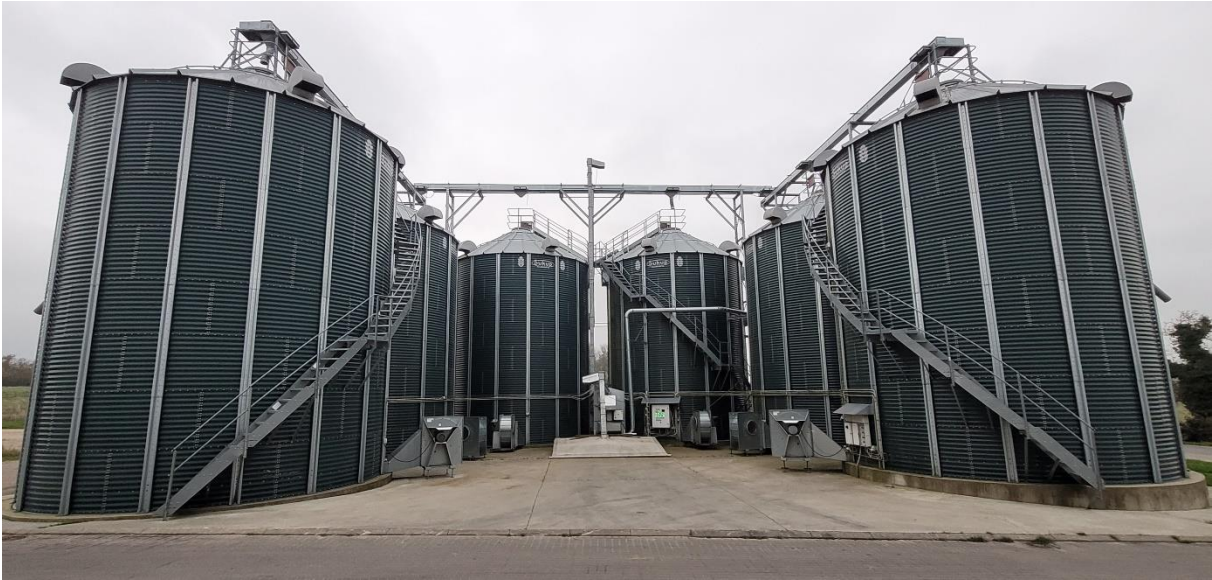
Billede 15. Udendørs silobatteri med 6 stk. 330 m 3 tørresiloer med omrøring.

Udendørs tørresiloer er en oplagt løsning, når konsumafgrøder skal holdes adskilt. Men det kræver at der er en vis volumen i hver afgrøde. Tørresiloer fås fra ca. 235 m 3 , svarende til ca. 180 ton hvede, og giver stor sikkerhed for ensartet tørring pga. omrørersystemet. Til afgrøder hvor der er risiko for våd høst, som fx hestebønner, anbefales det at bygge siloen bred, og med mindre højde, da omrørersystemet eller kan blive overbelastet.