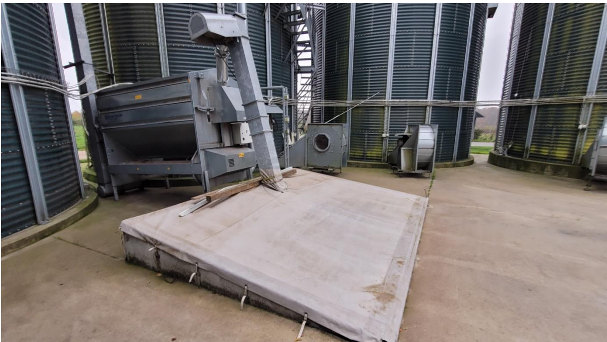
Billede 16. Korngrav med forrensning før transportanlægget.

Ved opbygning af transportanlæg bør rengøring indtænkes. Det eneste transportsystem der er 100% sortsren er lufttransport. Ved elevator- / redleranlæg bør der altid laves et endeudløb på redleren i toppen, så der kan køres minimum 200-300 kg "skylleafgrøde" igennem anlægget til en skyllesilo eller en vogn, hvorfra det fx opfodres.