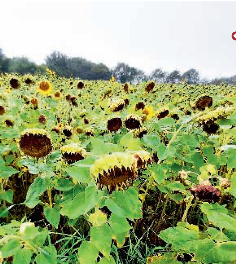
← Høst: De danske solsikker skulle høstes med et majs-skærebord og ensileres i wrapballer.

hold af fedt, som gør dem interessante, mener Solvejg Horst Petersen.