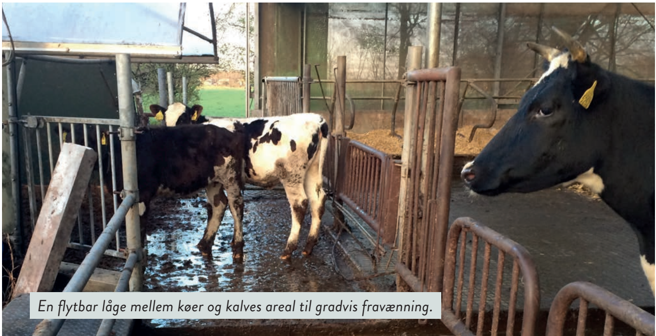
En flytbar låge mellem køer og kalves areal til gradvis fravænnning.

I et ko-kalv-system i en malkekvægbesætning vil fravænnning og adskillelse mellem ko og kalv som regel ske efter langt kortere tid, end det ville være sket i naturen. Men der er stadig nogle af naturens principper, som kan gennemføres i en malkekvægbesætning, såsom at tilstræbe en gradvis og trinvis proces.