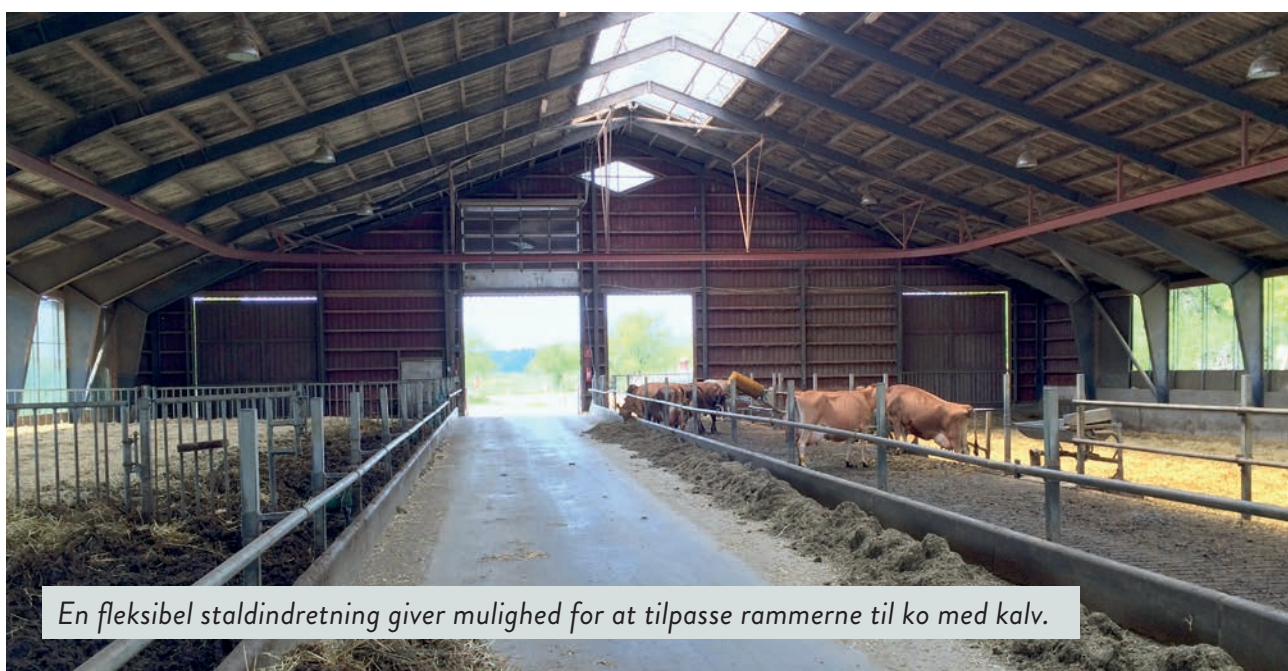
En fleksibel staldindretning giver mulighed for at tilpasse rammerne til ko med kalv.

Der findes i dag ingen stalde til malkekøer, som er designet til, at køer og kalve kan gå sammen. Stort set alle eksisterende ko-kalv-systemer i dag i Nordvesteuropa har det til fælles, at de har måttet indrette sig i et eksisterende staldsystem, som oprindeligt ikke var beregnet til ko-kalv-system.