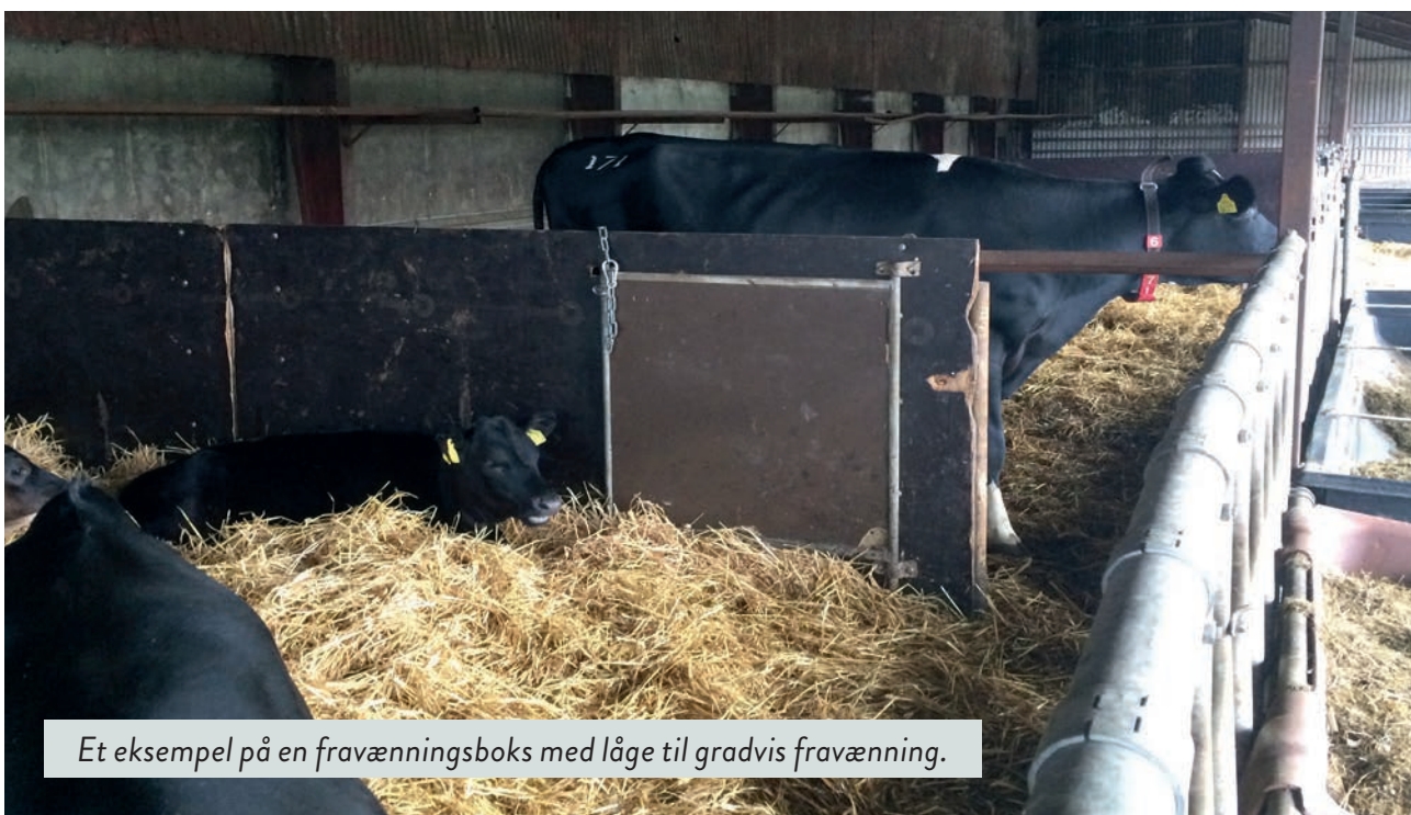
Et eksempel på en fravænningsboks med låge til gradvis fravænnning.