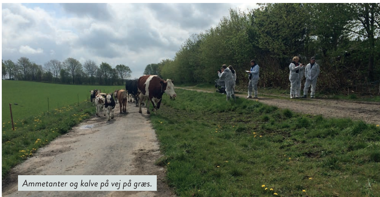
Ammetanter og kalve på vej på græs.

Det er en stor fordel at starte op med at afprøve ko og kalv sammen systemet i en sommerperiode. Her er vejret for det meste godt, og der er masser af plads og græs ude til de dyr, det kan være vanskeligt at have plads nok til i stalden.