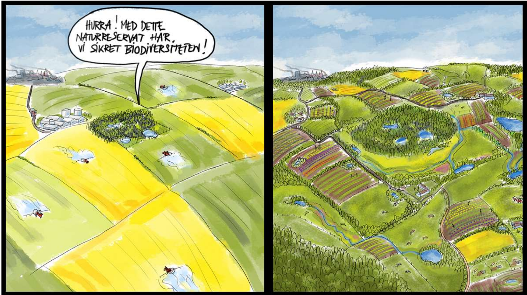
Illustration: Morten Telling - Moxtell