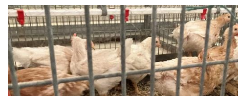
Fig 4. Forsøgskyllinger i mindre bokse i forsøgsstalden i Foulum.