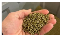
Fig 3. Foder med alge- og ærteprotein.

I 2024 udføres der praktiske boksforsøg med algeprotein mv. samt demonstration hos Rokkedahl. Læs mere om projektet her: ProLocAL(icrofs.dk)